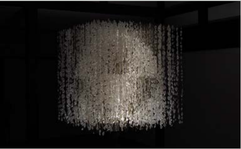
O33 《うつせみ-ほうえん》(2023) 羊腸

1993年中国・内モンゴル生まれ。金沢美術工芸大学大学院博士課程2年。少数民族として、モンゴル民族と漢民族との文化の狭間で育った背景から「あちら側でもこちら側でもない」両義的なものに関心を寄せる。牛や羊といった家畜の腸を素材に、インスタレーション作品を制作している。近年の作品には、チベット仏教に基づく輪廻の思想を反映した《うつせみ-ほうえん》(2023, 「記憶をほどく、編みなおす」ギャラリー無量/砺波)、主な展覧会に「GO FOR KOGEI 2023」(2023, 岩瀬エリア・沙石/富山)がある。