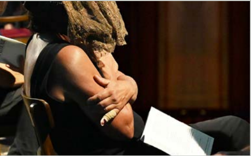
Salon d' Amour' by Margret Wibmer, participative performance and artist publication. 2023 - ongoing.

オーストリア・リエッツ生まれ。アムステルダム在住。日常の素材を用いたパフォーマンスやオブジェ、写真の制作を通じ、人間の根源的な感情を探求している。主な作品に、著名な哲学者や文学者などが恋人に充てた手紙を朗読して聞かせるパフォーマンス作品《Salon d'Amour(愛のサロン)》がある。2022年にはアメリカの「カルチュラル・アクティビズム」に参加し、パフォーマンス作品《スロー・ウォーク》(2022)を発表。いずれも世界各地で上演している。